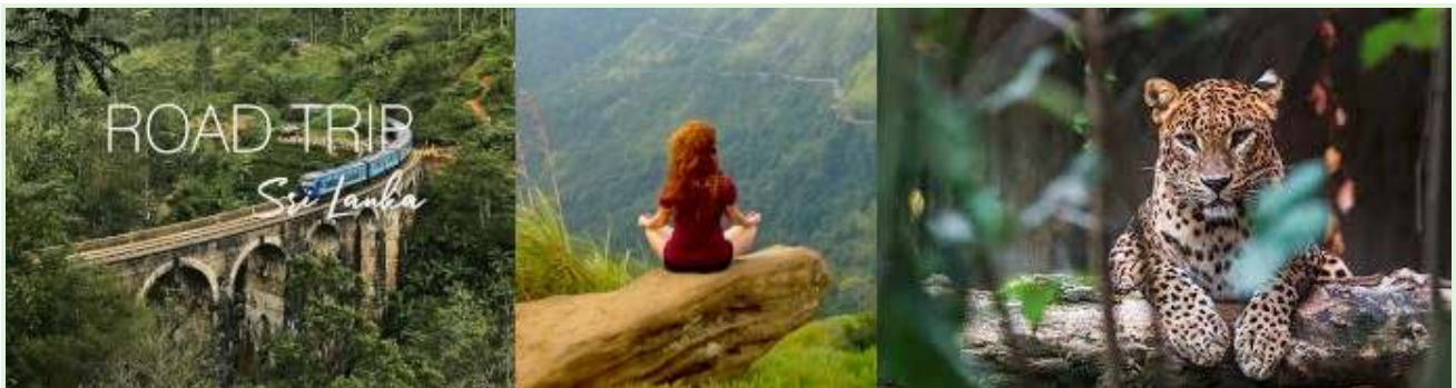
Vacaciones en Sri Lanka - Visitas guiadas por la naturaleza y expediciones

Momento: El experimento se lanzó durante la pandemia de COVID-19, cuando la economía de Sri Lanka, dependiente del turismo, ya estaba gravemente afectada.